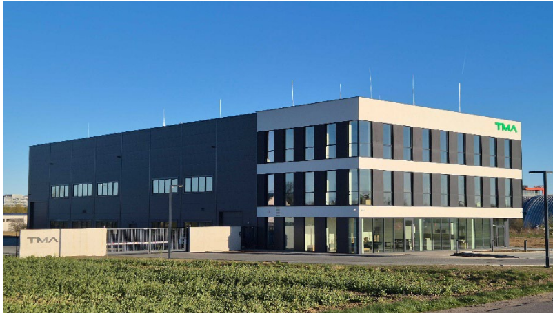
Die neue Unternehmenszentrale und der Produktionsstandort von TMA Automation in Danzig.